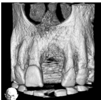
DVT (Digitale Volumentomographie) (Kieferdefekt)